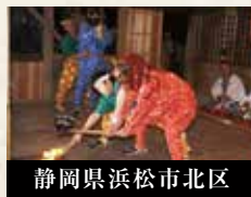
静岡県浜松市北区

寺野のひよんどりは、直笛山宝蔵寺観音堂（通称三日堂）で正月3日に行われている五穀豊穡を祈る春祈祷の祭です。観音堂の外陣において一同が松明を持って輪になって踊る火踊りが印象的なことから、それがなまって「ひよんどり」という名称になったといわれています。