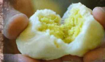
田舎まんじゅう作り体験