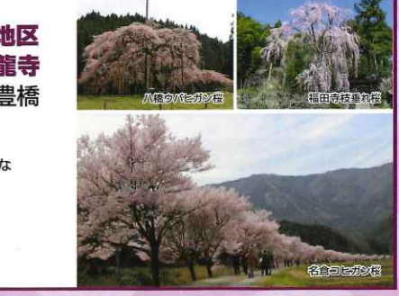
八橋ウバヒガン桜

※花は自然のもので、気象条件等によりご覧いただけない場合がございます。予めご了承ください。