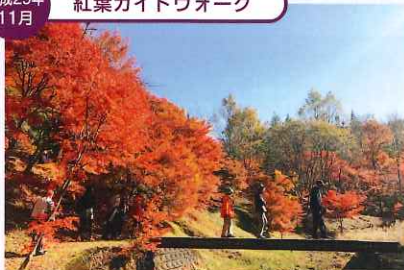
平成29年11月 紅葉ガイドウォーク