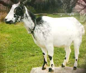
つくで高原ハウス (動物ふれあい体験)