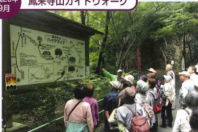
平成29年9月 鳳来寺山ガイドウォーク