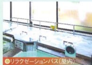
●リラクゼーションバス(屋内)

野天風呂のお湯よりも強い成分を抜いてあります。刺激が少ないので、肌の弱い人にはこちらのお湯がオススメです。