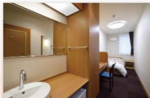
シングルルーム(定員1人)

客室は、シングル、ツイン、 トリプルの3タイプを用意 しています。 ツインルームは、エキス トラベッドの使用により、 3名まで宿泊が可能です。