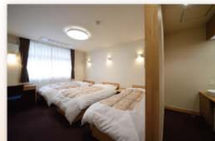
トリプルルーム(定員3人)