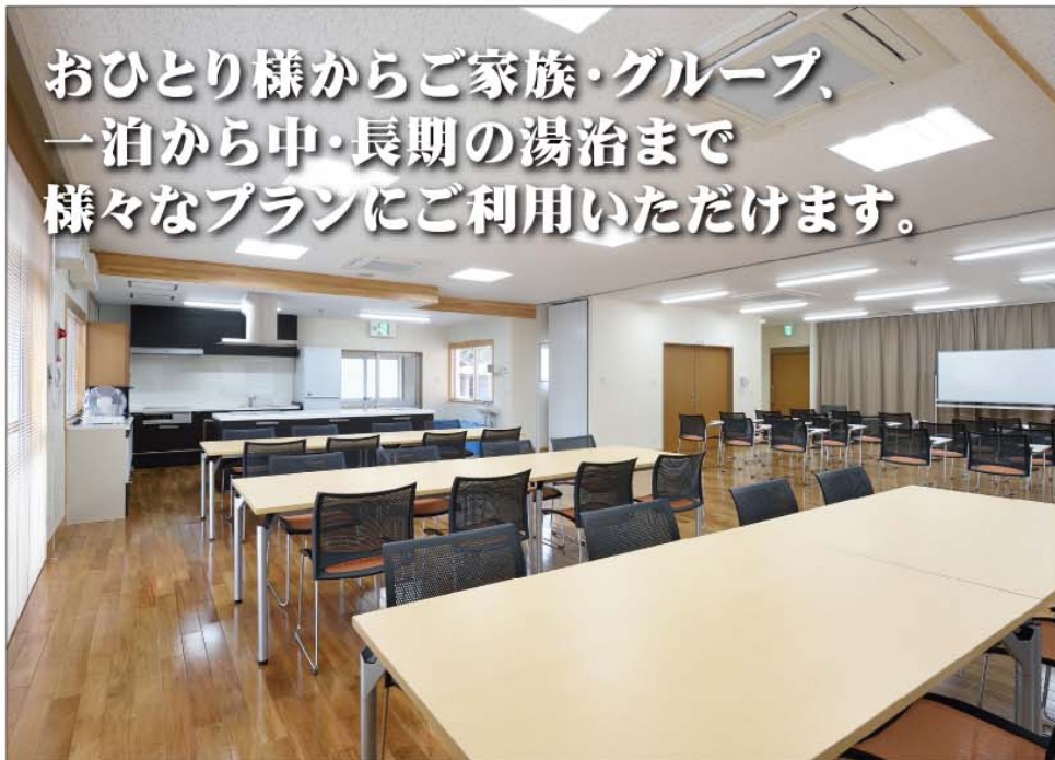
ダイニング ダイニングは83㎡の広々空間です。食事の他、セミナーや会議など幅広い用途に利用できます。

おひとり様からご家族・グループ、 一泊から中・長期の湯治まで 様々なプランにご利用いただけます。