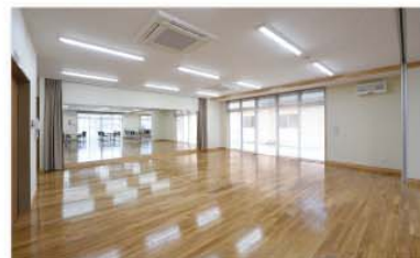
スタジオ兼会議室