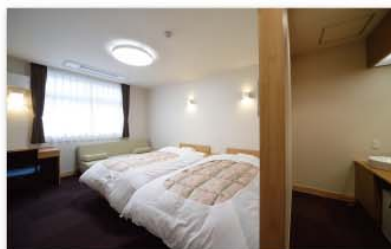
ツインルーム(定員2~3人)

客室は、シングル、ツイン、 トリプルの3タイプを用意 しています。 ツインルームは、エキス トラベッドの使用により、 3名まで宿泊が可能です。