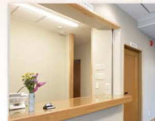
インフォメーション