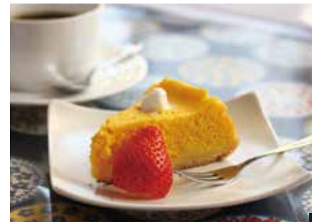
① ケーキセット(好きなケーキ+好きなドリンク) 700円