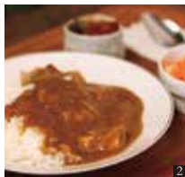
② 豚とろとろカレーライス 700円