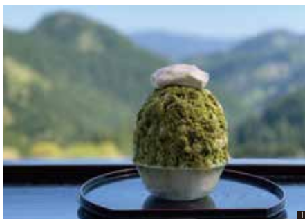
① 大人気!雲上茶ミルク 900円