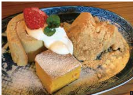
① おやつプレート 600円