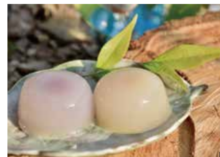
① 【夏限定】見た目もきれいな水まんじゅう 150円