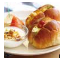
② ちやちやカフェモーニング 500円