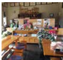
③ 店内でお茶の飲み比べもできます。