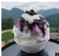
② ブルーベリーヨーグルト 1,000円(季節限定)