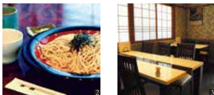
② 注文を伺ってから作る打ち立ての十割そば 大1,000円、並600円 ③ 落ち着いた店内。テイクアウトも可能です。※表示金額は税別

東栄町本郷森山18-14 0536-76-1766 11:00~21:00 月曜日・木曜日