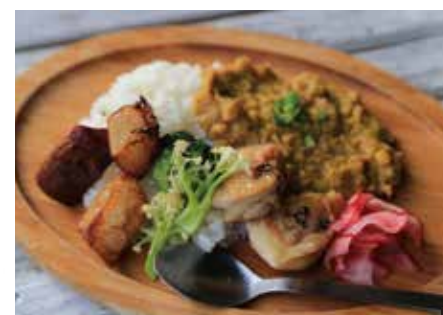
① 季節のプレート 800円~