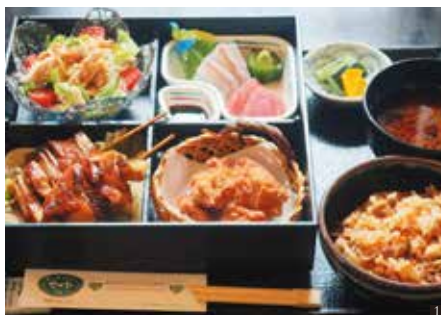
① 地元産の若鶏をふんだんに使用。錦爽鶏御膳2,200円