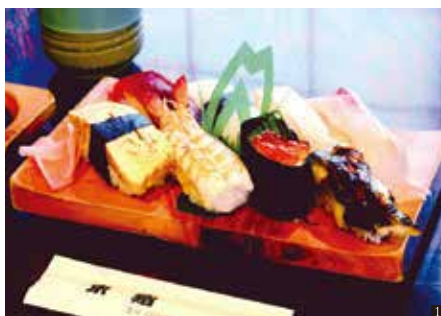
① おまかせ握り寿司 700円 ※税別