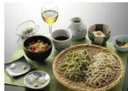
① 2種類のそばが楽しめる雲上セット 1,650円