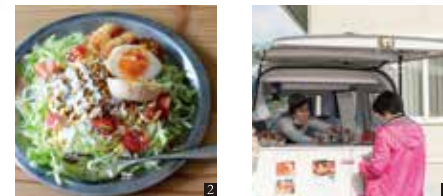
② タコライス 800円~ ③ 不定期で東栄町役場前やイベント等へキッチンカーで出店

東栄町本郷下前畑6-1 0536-76-1860 SNSで営業日時・出店等公開します 休 不定休