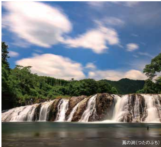
鳶の淵(つたのふち)