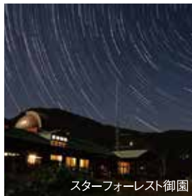
スターフォーレスト御園