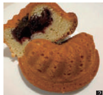
② 甘酸っぱい自家製ブラックベリーソース入りバターケーキ