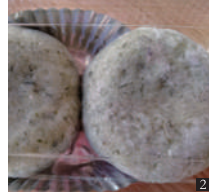
② あんころ餅 300円