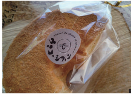
① 人気の「ウマコのシフォンケーキ」ハーフ340円、ホール680円