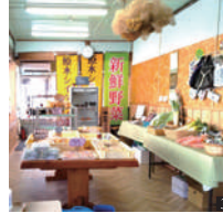
③ 店内には、パンやお惣菜だけでなく、地元の野菜や工芸品も

東栄町下田市場32-5 0536-76-0103 10:00~16:00 土・日・月・火曜日