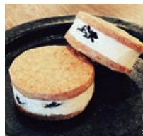
③ 国産ブランデー使用バタークリームはあっさり&芳醇な香り

東栄町本郷東万場27-3 0536-76-1796 12:00~15:00 不定休 ※営業日はInstagramより