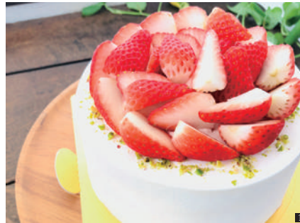
① 旬のいちごたっぷり! 無添加クリームはあっさりとお食べられます。