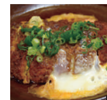
② かつ鍋定食 1,200円 ③ 店内ではお土産品も購入できます。