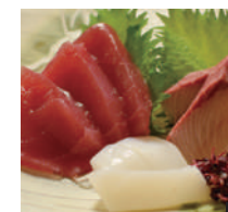
② 新鮮なお刺身 ③ ゆったり食事ができる宴会場