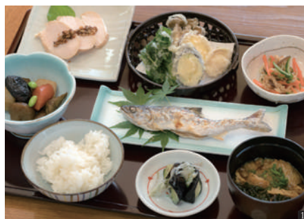
① 季節の食材がふんだんに使われた千代姫セットランチ1,650円～