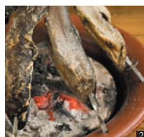
② 川魚の塩焼き 800円～(6月～10月頃まで) ③ 囲炉裏のお部屋でお食事できます。