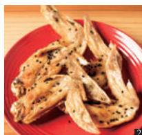
② 錦爽どりの手羽唐 1本 170円 ③ 築90年の古民家をおしゃれに改装