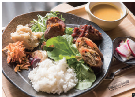
① 和洋の選べるセットランチ 1,100円～1,700円