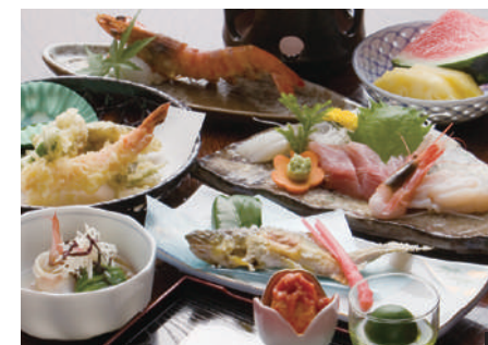
① 旬の会席料理 3,500円～予算に応じて