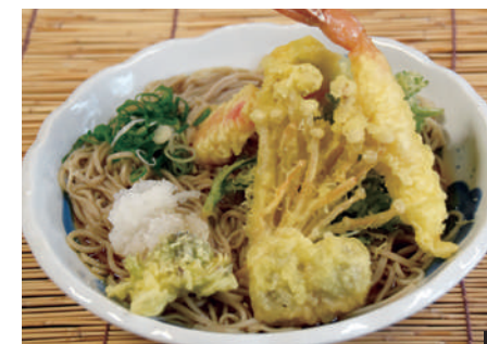
① おおぶりのえびが乗ってこの値段!えび天そば 900円