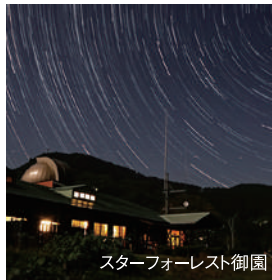
スターフォーレスト御園