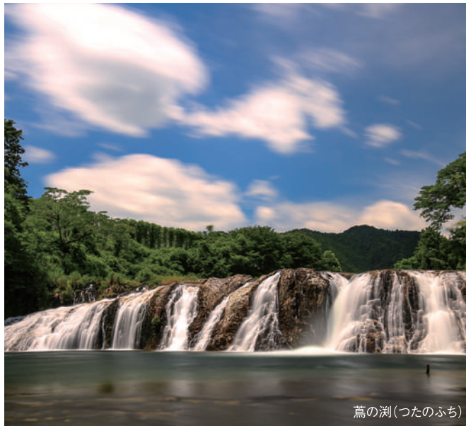
葛の湖(つたのふち)